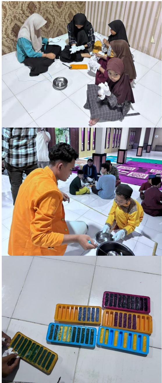
Gambar 3. Praktik membuat krayon

anak dalam mengolah limbah menjadi produk bernilai guna. Kegiatan pengabdian masyarakat yang dilakukan merupakan salah satu upaya untuk meningkatkan pengetahuan peserta. Berbagai bentuk kegiatan dapat dilakukan untuk meningkatkan pengetahuan warga baik melalui pelatihan, sosialisasi ataupun penyuluhan langsung dan tidak langsung [11],[12]