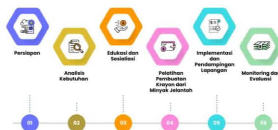
Gambar 1. Tahapan Pelaksanaan Kegiatan

Kegiatan pengabdian kepada masyarakat ini dilaksanakan di Panti Asuhan Aisyiyah Muhammadiyah Kuala Tungkal, Kabupaten Tanjung Jabung Barat, Provinsi Jambi. Program berlangsung selama dua bulan, mencakup tahap persiapan, pelaksanaan, hingga evaluasi akhir. Sasaran kegiatan adalah 30 anak asuh yang terdiri atas yatim, piatu, yatim piatu, dan dhuafa dengan rentang usia 7–17 tahun. Peserta berasal dari latar belakang pendidikan sekolah dasar hingga menengah, sedangkan lokasi utama kegiatan adalah aula panti asuhan yang difasilitasi oleh pengurus lembaga.